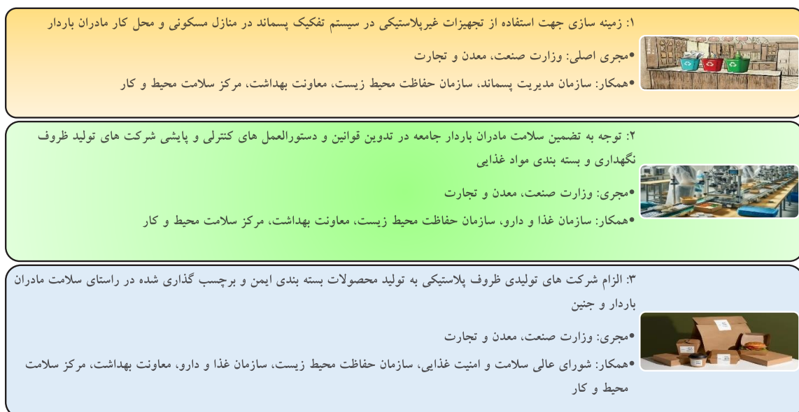
شکل ۲- راهبردهای اجرایی موثر بر کاهش مواجهه مادران باردار با میکروپلاستیک‌ها

توصیه‌های مرتبط با راهبرد آموزش ۱. تشکیل جلسات آموزشی در سطح کلان جهت افزایش دانش سیاستگذاران ملی و منطقه ای ۲. تشکیل کارگروه نخبگانی در راستای تدوین سرفصل آموزشی در مراکز دانشگاهی ۳. تشکیل کارگروه تحقیقاتی جهت شناسایی مواجهات جامعه با میکروپلاستیک‌ها در راستای تدوین محتوای آموزشی جامع ۴. تشکیل کارگروه و برگزاری جلسات منظم جهت تدوین محتواهای آموزشی مرتبط براساس انتظارات ۵. تسهیل در تهیه و نشر پمفلت، پوستر، کتاب و انیمیشن‌های آموزشی ۶. تهیه بسترهای ضروری و به روز جهت آموزش مطلوب و کارا در جامعه همچون تهیه اپلیکیشن‌های آموزشی برای مادران ۷. تهیه نقشه ورود میکروپلاستیک‌ها به بدن انسان جهت تدوین انیمیشن‌های آموزشی موثر بر ارتقای دانش مادران باردار و پیشگیری از بروز مواجهه های غذایی، تنفسی و پوستی با میکروپلاستیک ها بویژه در گرم کردن مجدد غذا و استفاده از لباس‌های مختلف ۸. تهیه بسته‌های آموزشی فعالیت ایمن و موثر در کاهش