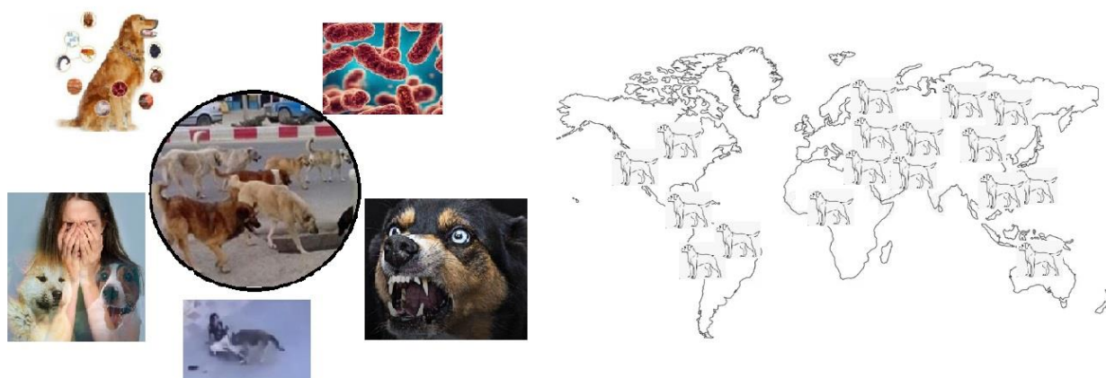
شکل ۲- توزیع موضوعی و مکانی مطالعات وارد شده به این مرور

را تشکیل می داد کمترین تعداد مقالات در طبقه بندی سال انتشار مقالات را شامل می شد. همچنین بررسی موضوعی مقالات وارد شده به این مطالعه نشان داد موضوعات مرتبط با بیماری‌های باکتریایی و انگلی سگ‌های ولگرد در سال‌های اخیر بیشتر مورد توجه محققان و پژوهشگران بوده است.