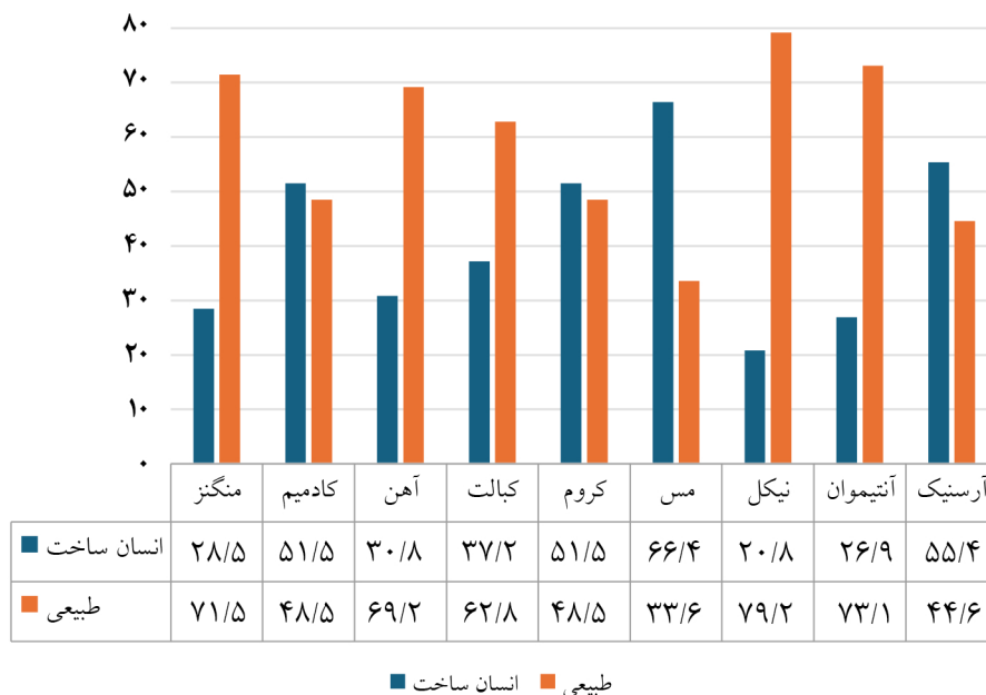
شکل ۲- مقایسه درصد انسان ساخت و طبیعی فلزات سنگین در خاک های کشاورزی منطقه مورد مطالعه

جزء تبدلی (f1): فاز محلول در پیوند با کرنات ها است و پیوند سست دارد. جزء قابل احیاء (f2): فاز متصل به اکسیدهای آهن و منگنز. جزء قابل اکسید (f3): فاز متصل به مواد آلی و سولفیدها. جزء باقیمانده (f4): فاز پایدار(پیوندهای مقاوم و میان بطنی).