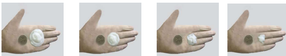
تصویر ۱ تصویر ۲ تصویر ۳ تصویر ۴