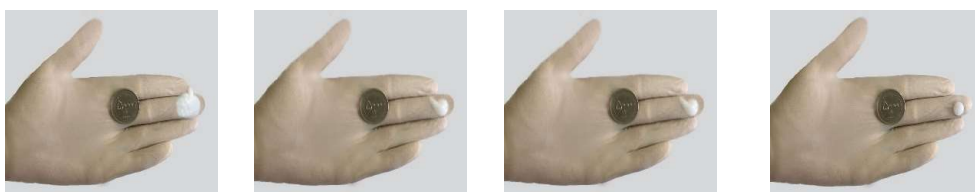
تصویر ۱ تصویر ۲ تصویر ۳ تصویر ۴