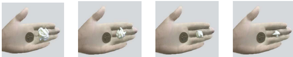
تصویر ۱ تصویر ۲ تصویر ۳ تصویر ۴

۹. لطفاً برای هر محصول مراقبت شخصی در زیر تصویری را انتخاب کنید که نشان‌دهنده مقدار متوسطی است که شما در هر بار استفاده می‌کنید.