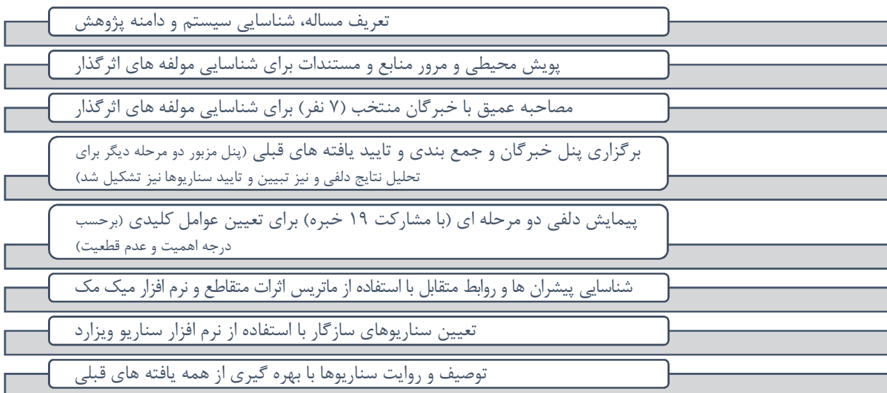
شکل ۱- چارچوب و گام‌های روش پژوهش