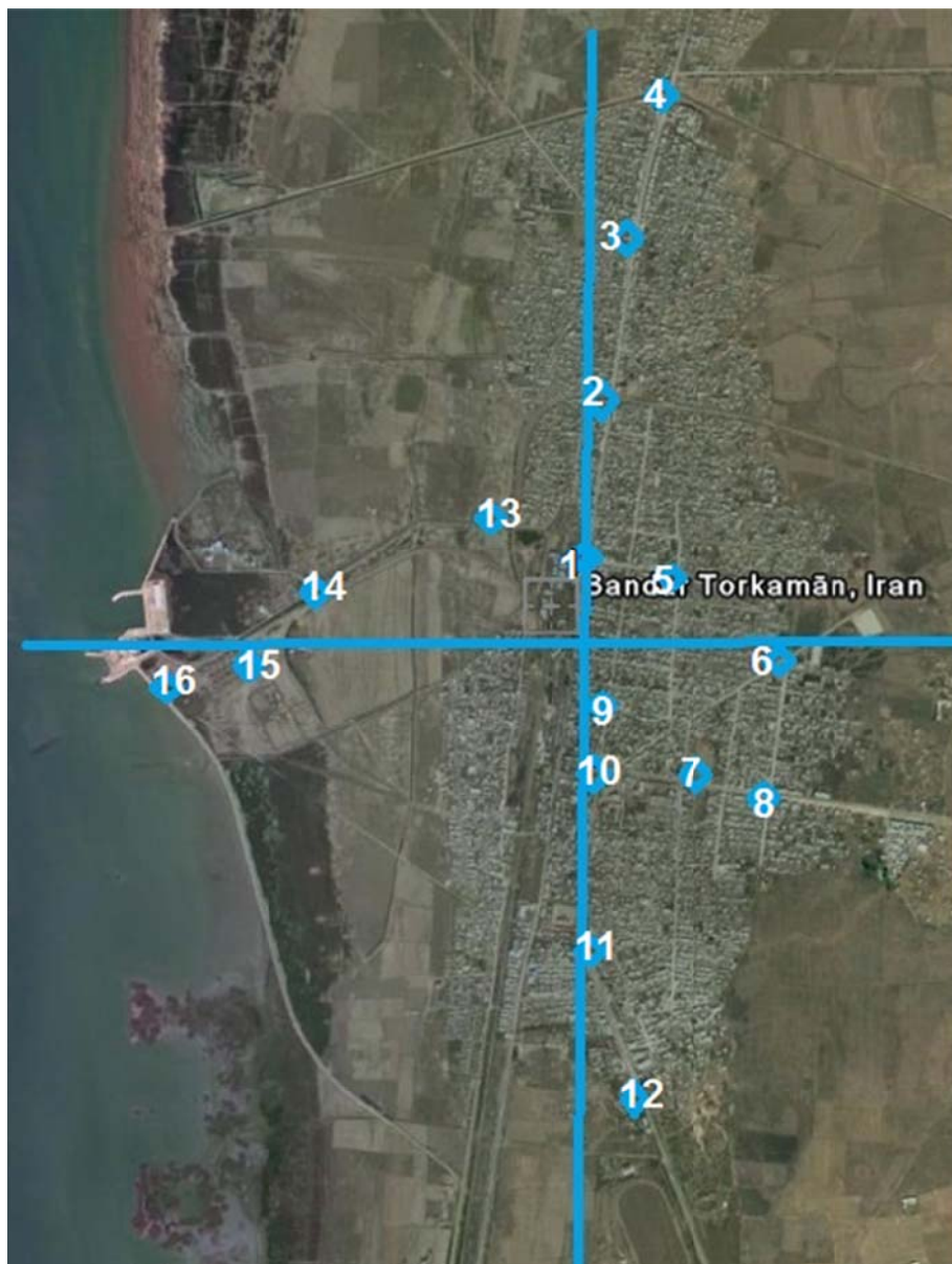
شکل ۲- ایستگاه‌های اندازه‌گیری آهنگ دز گامای محیطی در فضای باز در شهر بندر ترکمن

به دست آمده پس از طبقه بندی، توسط نرم افزار Excel و با آزمون آماری T (T-test) مورد تجزیه و تحلیل قرار گرفت. استان گلستان در شمال ایران واقع شده است و طول و عرض جغرافیایی شهرهای گرگان به ترتیب 54/16 و 36/58 درجه و بندر ترکمن 54/04 و 36/54 درجه است. شهر گرگان با وسعتی بیشتر از 60 \text{ km}^2 طبق آخرین سرشماری سراسری که در سال