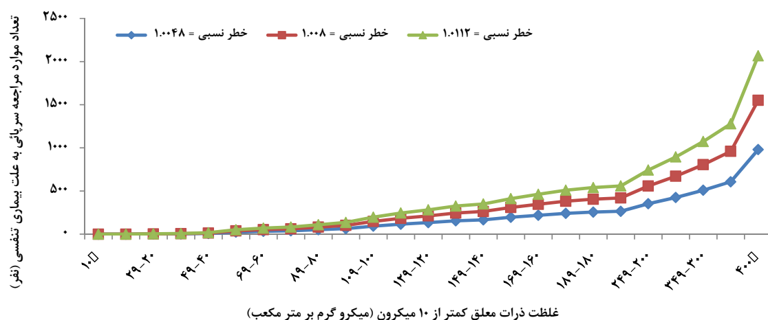
شکل ۳: رابطه میان تعداد تجمعی موارد مراجعه سرپائی به علت بیماری تنفسی متناسب به PM_{10} در برابر فواصل غلظت توسط مدل در شهر اهواز