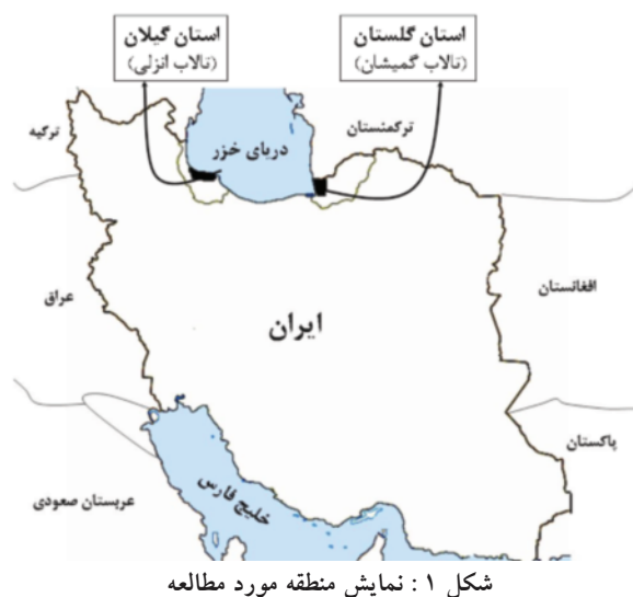
شکل ۱: نمایش منطقه مورد مطالعه

عمدتا ورود جیوه و مشتقات آن به بدن انسان، از طریق مصرف مواد غذایی و آبریان صورت می گیرد (۱۰). میانگین غلظت جیوه در بافت های مورد مطالعه به صورت جدول زیر می باشد (جدول ۱). نتایج نشان می دهند میزان جیوه در کبد همه گونه ها، به جز چنگر بیشتر از سایر بافت ها است. دلیل اصلی این موضوع به نقش کبد در فرایند متیلاسیون جیوه و درصد چربی بیشتر این بافت نسبت سایر بافت های داخلی در این دو گونه برمی گردد (۷). در چنگر به دلیل این که از یک طرف در سطح غذایی پایین تری قرار گرفته و از طرف دیگر رژیم غذایی این گونه کمتر مواد آلوده به جیوه دارد، همچنین درصد چربی بافت های آن نسبت به دو گونه دیگر کمتر بوده و طول عمر بسیار کمتری دارد، لذا میزان جیوه بیشتر در پرتجمع یافته است. همچنین عضله این گونه کمترین میزان جیوه را نسبت به همه بافت ها در هر سه گونه داشته است.