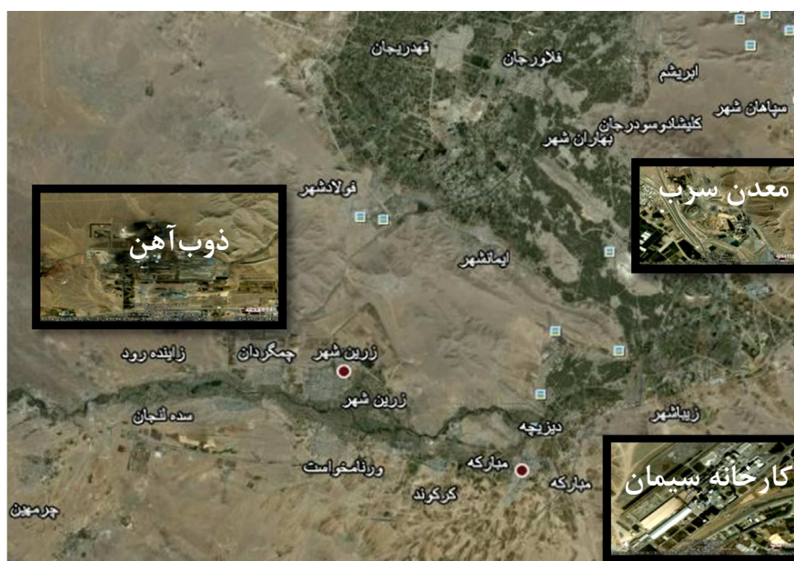
شکل ۱: اراضی منطقه مورد مطالعه

در بالن ژوژه ۵۰ mL جمع‌آوری و توسط دستگاه دستگاه جذب اتمی مدل پرکین المر (Atomic Absorption – Perkin Elmer 3030 غلظت فلزات سنگین کادمیوم و سرب تعیین گردید (۱۷). توصیف آماری داده‌ها با استفاده از نرم‌افزار Statistica نسخه ۶ صورت گرفت. همچنین مقایسه میانگین‌ها با آزمون LSD انجام شد.