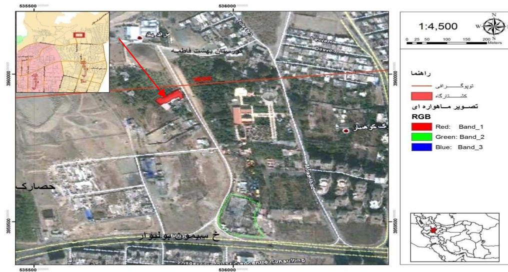
شکل ۱: موقعیت جغرافیایی محل تحقیق (۱۴)

و خطای ۳٪، تعداد نمونه‌های لازم (۳۲ نمونه) با استفاده از رابطه کوکران محاسبه گردید.