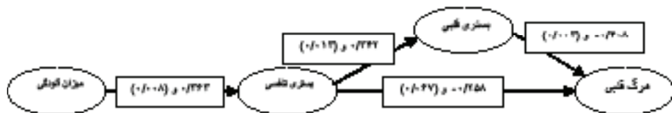
شکل ۲: مدل تحلیل مسیر بر اساس برآورد روابط استاندارد بین متغیرها (داخل پراتز سطح معنی داری)

آزمون فرضیات با استفاده از روش تحلیل مسیر: بر اساس ضرایب همبستگی معنی دار می‌توان از شکل ۱، شکل ۲ را استخراج و معرفی نمود.