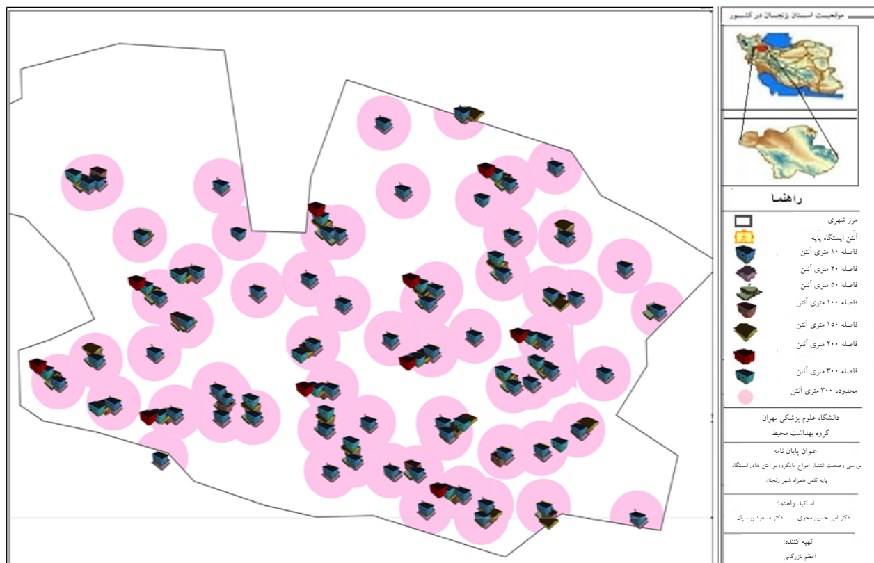
شکل ۲: نقاط انتخاب شده جهت بررسی شارچگالی توان امواج مایکروویو در محیط‌های درونی مجاور ایستگاه های پایه

با توجه به نتایج حاصل از تحلیل واریانس تک متغیره و مقایسه دو به دو میانگین چگالی توان امواج مایکروویو (فاصله و ارتفاع)، در فاصله اطمینان ۹۵٪ بین میانگین اندازه‌گیری‌ها در فواصل ۰، ۳، ۶، ۹، ۱۲، ۲۰، ۵۰، ۱۰۰، ۱۵۰، ۲۰۰، ۳۰۰ m در تمام فواصل ۰، ۳، ۶، ۹، ۱۲، ۲۰، ۵۰، ۱۰۰، ۱۵۰، ۲۰۰، ۳۰۰ m ارتباط معنی دار آماری ( P\text{-value} < 0.05 ) مشاهده شد. مقایسه دو به دو میانگین چگالی توان امواج مایکروویو در ارتفاع‌های مختلف نشان‌دهنده ارتباط معنی‌دار آماری ( P\text{-value} < 0.05 ) بین میانگین اندازه‌گیری‌ها در ارتفاع‌های ۰، ۳، ۶، ۹، ۱۲، ۲۰، ۵۰، ۱۰۰، ۱۵۰، ۲۰۰، ۳۰۰ m (همکف) با میانگین سنجش‌ها در کل ارتفاع‌ها در فاصله اطمینان ۹۵٪ است. با افزایش ارتفاع چگالی توان نیز افزایش یافت. جهت بررسی همبستگی میان متغیرهای مستقل و متغیر وابسته از رگرسیون خطی چند متغیره استفاده گردید. با توجه به R^2 به دست آمده که عدد ۰/۷۹ است. در این داده‌ها متغیر فاصله و ارتفاع تواما تقریبا ۷۹٪ از واریانس چگالی توان امواج مایکروویو در محیط‌های درونی را توجیه می‌کند.