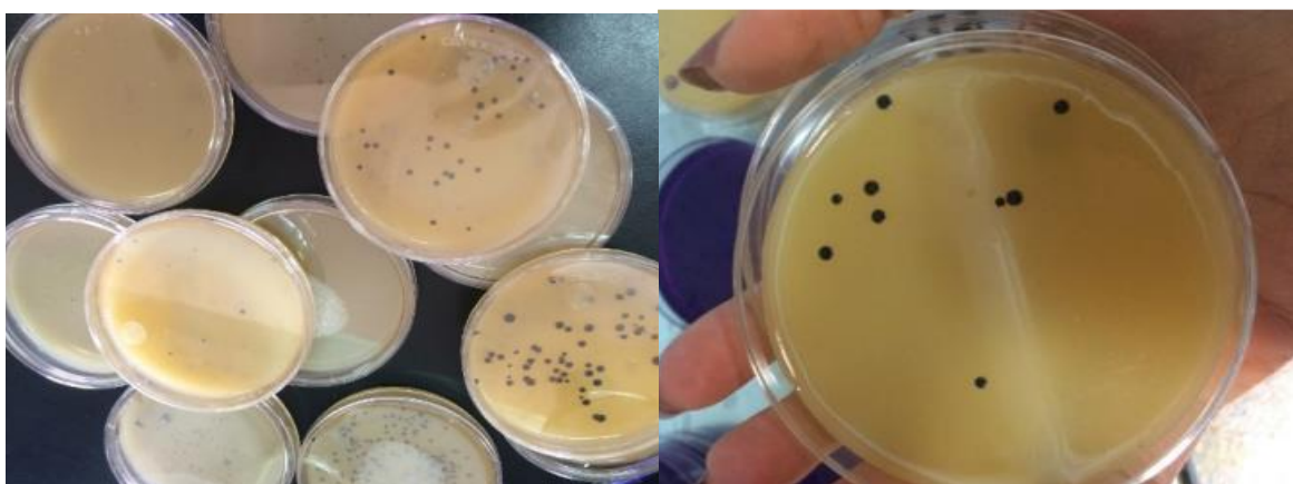
شکل ۱- پرگنه‌های سیاه استافیلوکوکوس روی محیط برد پارکر آگار

نمونه‌ها، از محیط غنی کننده با استفاده از فیلدوپلاتین بر سطح محیط کشت برد پارکر آگاراز پیش تهیه شده، به صورت خطی کشت داده شدند و ۲۴ تا ۴۸ h در دمای