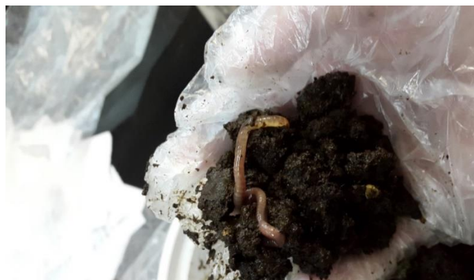
شکل ۱- نمونه کرم خاکی مورد استفاده در مطالعه

- تهیه کمپوست و کرم خاکی ایزنیافتیدا کمپوست و کرم خاکی ایزنیافتیدا مورد استفاده در این مطالعه از سایت کمپوست گاوی شهر هشتگرد تهیه شد (شکل ۱).