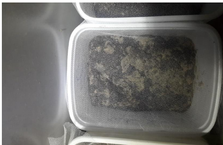
شکل ۲- آماده سازی راکتورها جهت انجام فرایند ورمی کمپوست