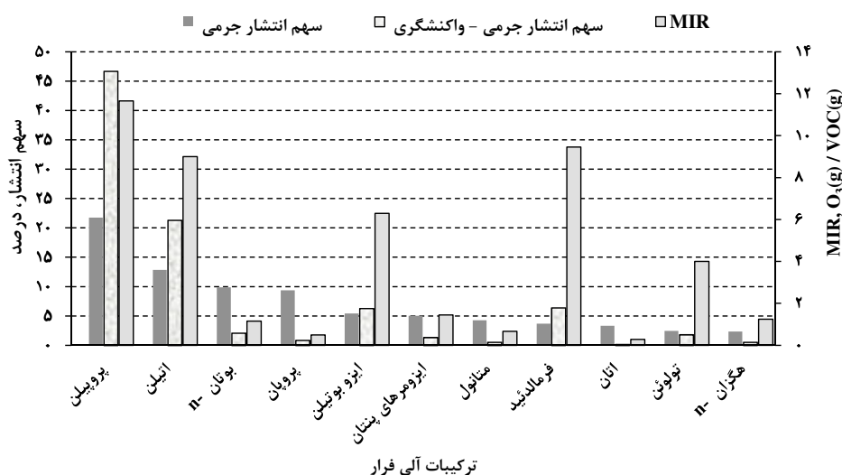
نمودار ۱- مقایسه سهم VOCs در فهرست جرمی (درصد) و فهرست جرمی - واکنشگری (درصد) و مقادیر MIR