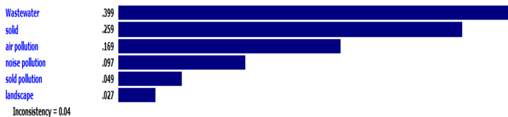
نمودار ۱- مقایسه زوجی آلودگی‌های زیست محیطی مورد مطالعه

مشاغل گروه ۴ وزن ۰/۵۶۵، مشاغل گروه ۳ وزن ۰/۲۶۲، مشاغل گروه ۲ وزن ۰/۱۱۸ و مشاغل گروه ۱ وزن ۰/۰۵۵ را دارند. به‌منظور مشخص شدن وزن نهایی و رتبه‌بندی مشاغل آلاینده پس از تلفیق وزن هر یک از آلودگی‌ها با گروه مربوطه (نمودار