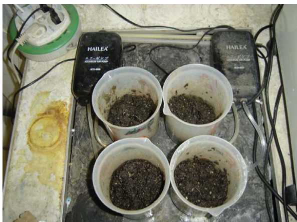
شکل ۱- راکتورهای بیولوژیکی کمپوست درون محفظه‌ای مورد استفاده