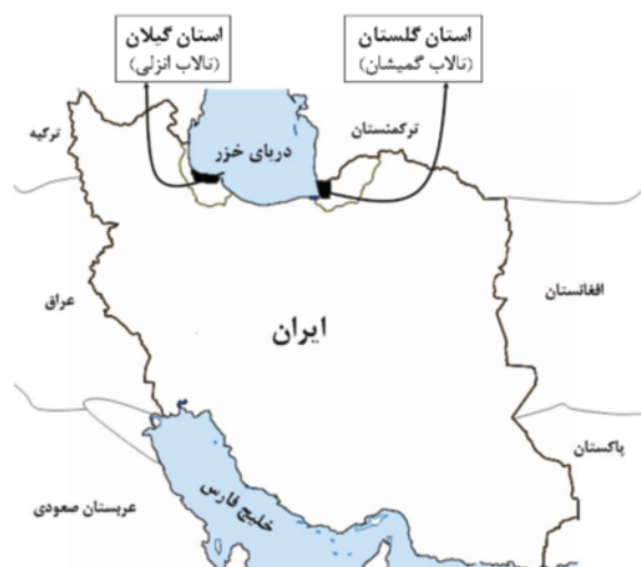
شکل ۱: نمایش منطقه مورد مطالعه

عمدتا ورود جیوه و مشتقات آن به بدن انسان، از طریق مصرف مواد غذایی و آبیان صورت می گیرد (۱۰). میانگین غلظت جیوه در بافت های مورد مطالعه به صورت جدول زیر می باشد (جدول ۱). نتایج نشان می دهند میزان جیوه در کبد همه گونه ها، به جز چنگر بیشتر از سایر بافت ها است. دلیل اصلی این موضوع به نقش کبد در فرایند متیلاسیون جیوه و درصد چربی بیشتر این بافت نسبت سایر بافت های داخلی در این دو گونه برمی گردد (۷). در چنگر به دلیل این که از یک طرف در سطح غذایی پایین تری قرار گرفته و از طرف دیگر رژیم غذایی این گونه کمتر مواد آلوده به جیوه دارد، همچنین درصد چربی بافت های آن نسبت به دو گونه دیگر کمتر بوده و طول عمر بسیار کمتری دارد، لذا میزان جیوه بیشتر در پرتجمع یافته است. همچنین عضله این گونه کمترین میزان جیوه را نسبت به همه بافت ها در هر سه گونه داشته است.