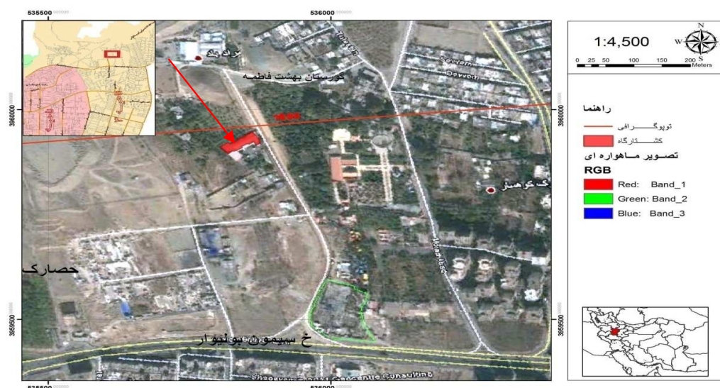
شکل ۱: موقعیت جغرافیایی محل تحقیق (۱۴)

و خطای ۳٪، تعداد نمونه‌های لازم (۳۲ نمونه) با استفاده از رابطه کوکران محاسبه گردید.