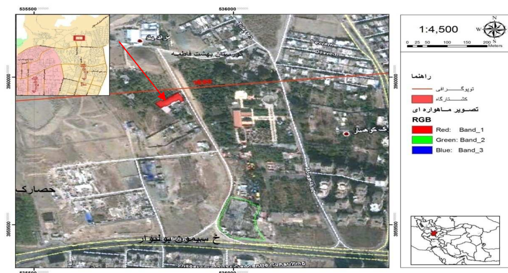
شکل ۱: موقعیت جغرافیایی محل تحقیق (۱۴)

و خطای ۳٪، تعداد نمونه‌های لازم (۳۲ نمونه) با استفاده از رابطه کوکران محاسبه گردید.