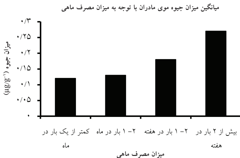
شکل ۴: اثر میزان مصرف ماهی مادر بر روی میزان جیوه مو و شیر مادر