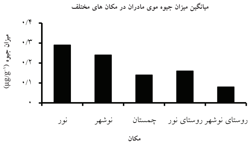
شکل ۲: بررسی اثر پارامتر مکان زندگی بر میزان جیوه موی مادر