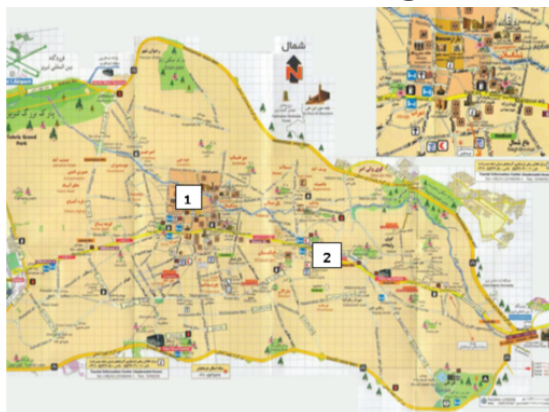
شکل ۱: نقشه شهر تبریز و موقعیت ایستگاه های اندازه گیری صدا

این پژوهش یک مطالعه از نوع توصیفی - مقطعی است. هدف از اندازه گیری آلودگی صدا در نقاط پرتراфик شهر تبریز مشخص نمودن وجود آلودگی صوتی در این شهر است. لذا ۲ نقطه شلوغ، پرتراфик و حساس شهر تبریز از نوع منطقه تجاری و تجاری - مسکونی برای این موضوع انتخاب گردید و روزانه در ۳ نوبت صبح (از ساعت ۷/۳۰ الی ۹/۳۰)، ظهر (از ساعت ۱۲/۳۰ الی ۱۴/۳۰) و شب (از ساعت ۱۹ الی ۲۱) مطابق روش اعلام شده از سوی سازمان EPA و به طور همزمان در دو ایستگاه منتخب انجام گرفته و بر حسب دسی بل در فرم های طراحی شده برای این منظور ثبت گردید. این اندازه گیری ها به مدت یک ماه تداوم یافت، به طوری که در هر یک از روزهای ایام هفته حداقل ۴ مرتبه سنجش در سه بازه زمانی مشخص شده صورت گرفته و در مجموع ۱۸۰ رکورد در طی این یک ماه نمونه برداری به دست آمد. داده های حاصل با استفاده از آمار توصیفی نرم افزار SPSS، مورد تجزیه و تحلیل آماری قرار گرفته و نمودارها در نرم افزار Excel رسم شدند. تراز معادل فشار صوت در ایستگاه ها با استانداردهای مربوط به صدا در هوای آزاد ایران به صورت روزانه (۷ صبح الی ۱۰ شب) مورد مقایسه قرار گرفت.