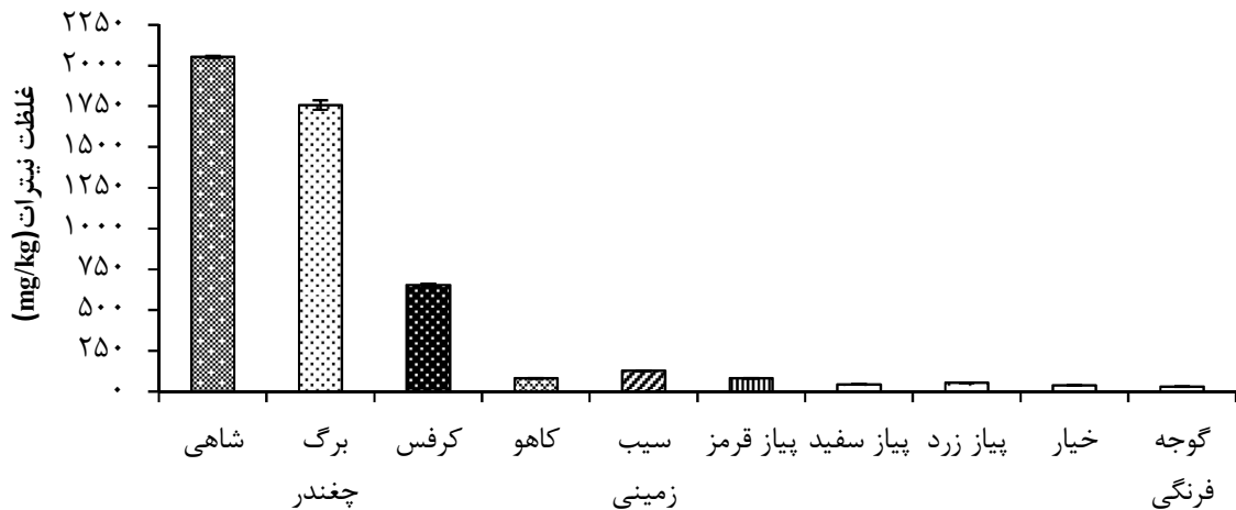
نمودار ۲- میانگین غلظت نیترات براساس وزن تر در سبزیجات مختلف موجود در بازارهای تره‌بار شهر کرمانشاه