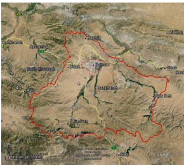
شکل ۱- حوضه آبخیز شهری بجنورد

ابنیه اصلی و مهم شهر همچون مجتمع‌های دانشگاهی و بیمارستان‌ها در بخش جنوبی شهر، عمارت مفخم و آبنه‌خانه در مرکز شهر، استادیوم ورزشی و فرودگاه بجنورد در شمال غرب محدوده شهر و همچنین شهرک‌های صنعتی در غرب شهر واقع شده‌اند. بیشترین میزان ترافیک در خیابان‌های طالقانی و امام خمینی و بلوار نیروگاه است که در جهت شرقی غربی گسترش یافته‌اند و از مرکز ثقل شهر عبور می‌کنند (۷).