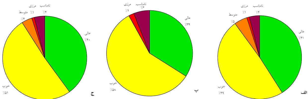
نمودار ۲- طبقه‌بندی کیفیت میکروبی آب استخرهای عمومی شهر تهران به تفکیک جنسیت: (الف) استخرهای بانوان، (ب) استخرهای آقایان و (ج) کل استخرها

توصیف و طبقه‌بندی کیفیت میکروبی آب استخرهای عمومی شهر تهران به تفکیک جنسیت در نمودار ۲ آورده شده است. همانطور که در این نمودار مشاهده می‌شود، کیفیت میکروبی آب بیشتر استخرهای مورد بررسی (هم استخرهای آقایان و هم استخرهای بانوان) در محدوده عالی و خوب قرار داشت، بطوری که از مجموع ۳۰۲ استخر مطالعه شده، کیفیت میکروبی آب در ۱۲۰ استخر عالی و در ۱۵۳ استخر خوب ارزیابی شد.