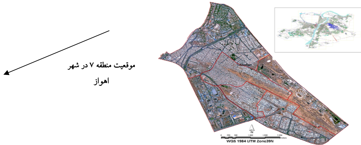
شکل ۱: موقعیت جغرافیایی منطقه حصیرآباد در شهر اهواز

به این منظور، از دستگاه اندازه‌گیری ۳D EMF TESTER مدل EMF - ۸۲۸ و روش اندازه‌گیری موجود در استاندارد (National Institute of Environmental Health Sciences) NIEHS (استفاده شد (۱۳). اندازه‌گیری شدت میدان مغناطیس در چهار فاصله ۱۵، ۳۱، ۶۱ و ۹۱ m از