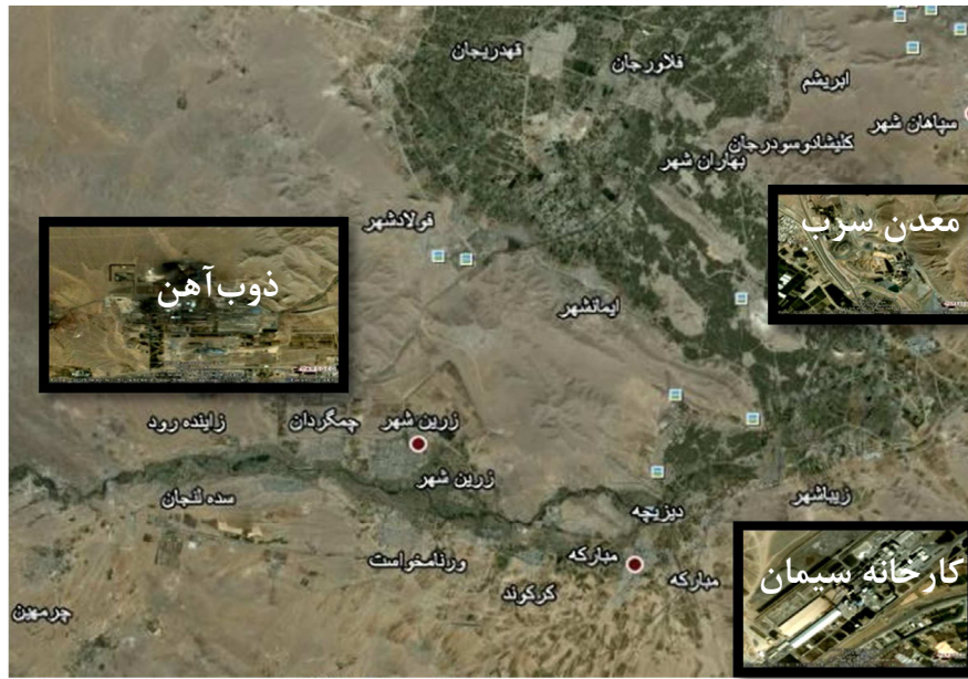
شکل ۱: اراضی منطقه مورد مطالعه

در بالن ژوزه ۵۰ mL جمع‌آوری و توسط دستگاه جذب اتمی مدل پرکین المر (Atomic Absorption) Perkin Elmer 3030 غلظت فلزات سنگین کادمیوم و سرب تعیین گردید (۱۷). توصیف آماری داده‌ها با استفاده از نرم‌افزار Statistica نسخه ۶ صورت گرفت. همچنین مقایسه میانگین‌ها با آزمون LSD انجام شد.