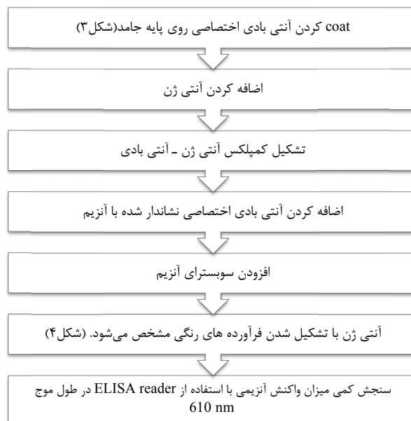
شکل ۲- مراحل کلی سنجش نشانگرهای زیستی با استفاده از روش ELISA (Enzyme-linked immunosorbent assay)

۰/۵ و ۰/۷۵ بترتیب برابر با ۰/۷۶، ۰/۹۶ و ۱/۳۳ شد. انحراف معیار غلظت نشانگر زیستی اینترلوکین شش ۰/۴۷ اندازه‌گیری شد. حجم EBC در مطالعه حاضر بین ۱/۲ mL تا ۳/۵ mL و میانگین آن ۲/۳ mL برای هر فرد اندازه‌گیری شد (۷). یافته‌های این مطالعه همچنین نشان دادند که نسبت نمونه‌های مثبت به منفی و نمونه‌های از دست رفته به کل نمونه‌ها بترتیب برابر با ۳۶/۲ و ۰/۳۸ بوده است.