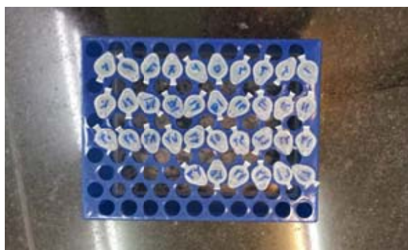
شکل ۳- شمایی از نمونه‌های کدگذاری شده