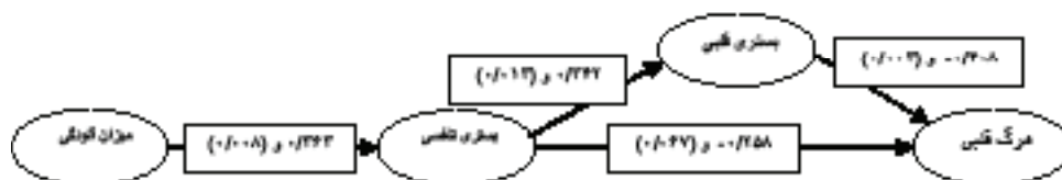
شکل ۲: مدل تحلیل مسیر بر اساس برآورد روابط استاندارد بین متغیرها (داخل پرانتز سطح معنی داری)

آزمون فرضیات با استفاده از روش تحلیل مسیر: بر اساس ضرایب همبستگی معنی دار می‌توان از شکل ۱، شکل ۲ را استخراج و معرفی نمود.