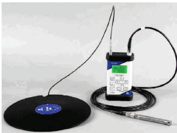
شکل ۱: نمایی از دستگاه ارتعاش سنج مدل SVAN 958