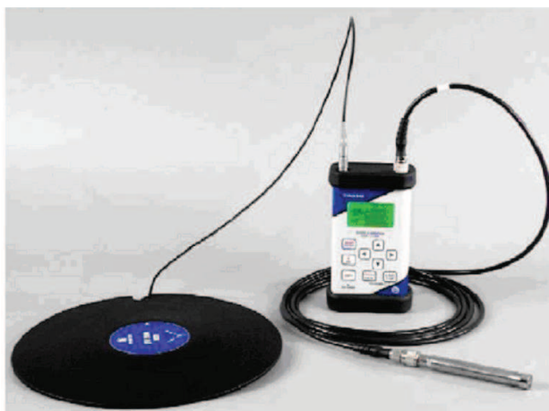
شکل ۱: نمایی از دستگاه ارتعاش سنج مدل SVAN 958